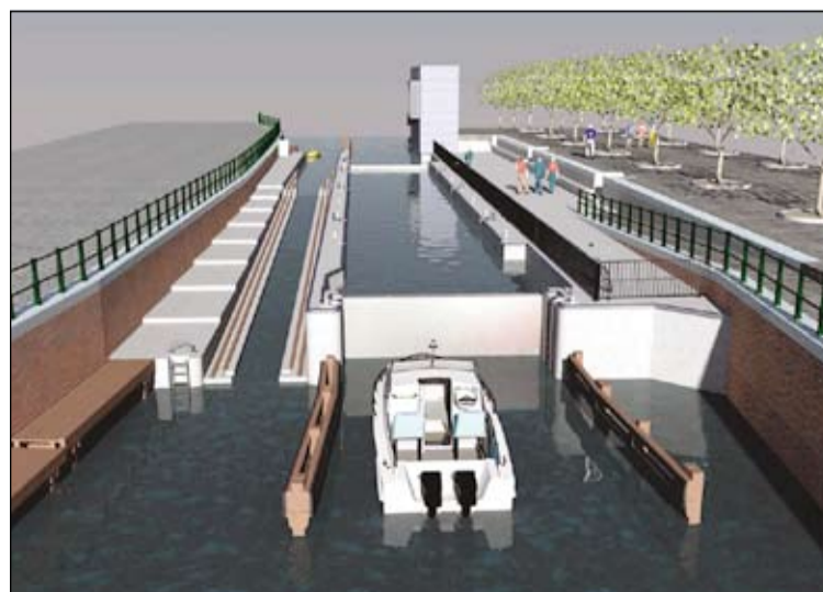
Met de Scaldissluis krijgt de pleziervaart de kans dieper in de stad door te dringen.