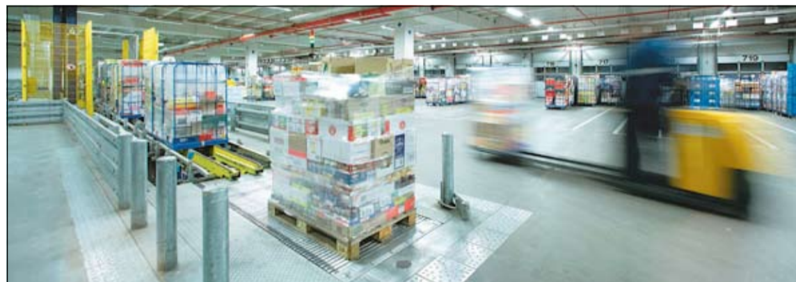
AMS wil zich buigen over strategische logistieke vraagstukken.